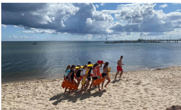
LIPIEC - SIERPIEŃ