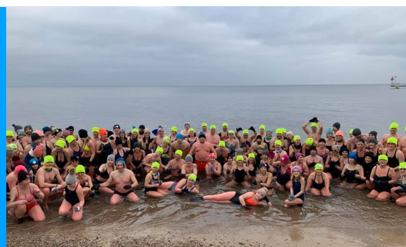
STYCZEŃ - MARZEC